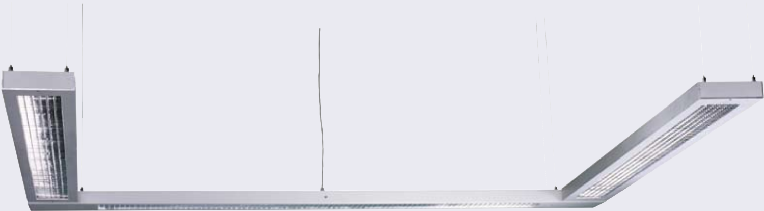
Dentist's Delight U 40 x 150 mm 170 x 190 cm 12 x 35 W