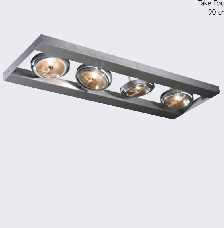
Take Four 90 cm