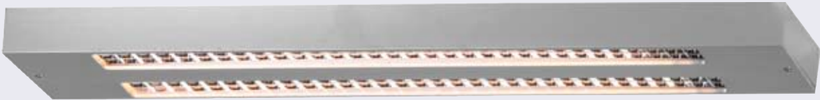
Short Bloke Rasterhängeleuchte 40 x 150 mm 65 cm 2 x 55/80 W