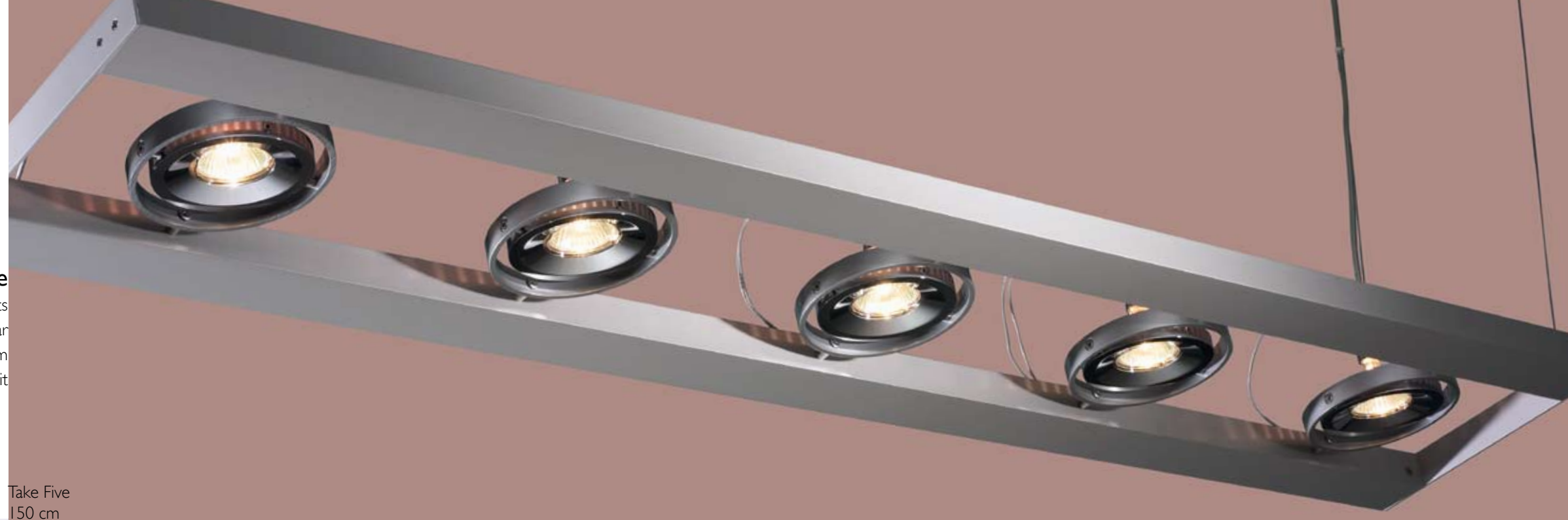
Take Five 150 cm

Kardanleuchte mit Halogenspots Spotanzahl und -abstand frei wählbar 50 – 300 cm 25 cm breit